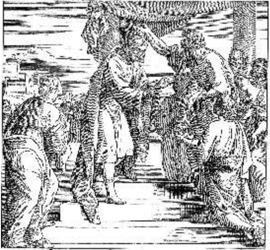
தாவீது இஸ்ரவேலின் மன்னராக முடிசூட்டப்படுதல்

மெசியா பற்றிய ச செய்தியை வழங்கும் நோக்கில் இரண்டாம் பாடல் திருப்பாடல்கள் நூலில் தொடக்கத்திலேயே இணைக்கப்பட்டுள்ளது என்று சொல்லப்படுகிறது, இது இறைவனால் திருப்பொழிவு செய்யப்பட்ட ஓர் அரசனைக் குறித்தப்பாடல் என்பதில் ஐயமில்லை மண்ணக அரசனைப் பற்றிப் பாடுவதாக உணர்த்தும் இப்பாடல் உண்மையில் எதிர்காலத்தில் இறைவனால் அனுப்பப்பட்ட