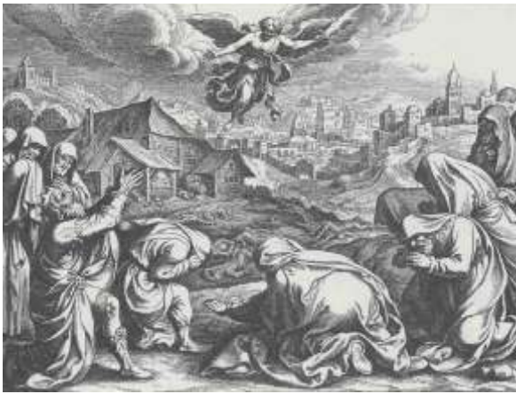
தாவீது அரசன் ஆண்டவரை நோக்கி அடிது புலம்பிச் செய்க்கிறார்

செல்லும்போது பகைவர்களின் கூட்டம் அவரைப் பார்த்து கொக்கரித்து, கேலிப் பரிகாசம் புரிந்து, கடவுள் அவனை விடுவிக்க மாட்டார் என்று மமதையுடன் பேசுகின்றது. தாவீது தன் நிலையை ஆண்டவருக்கு எடுத்துச் சொல்லி புலம்புகிறார். அது அவநம்பிக்கையின் அழகைக் குரல் அல்ல: வேதனையை வெளிப்படுத்தும் தாவீதின் குரலில்,