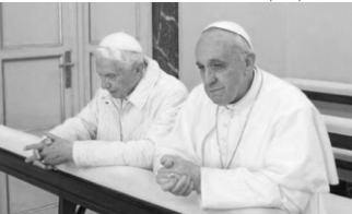
முன்னர் திருத்தந்தையுடன் இந்நாள் திருத்தந்தை